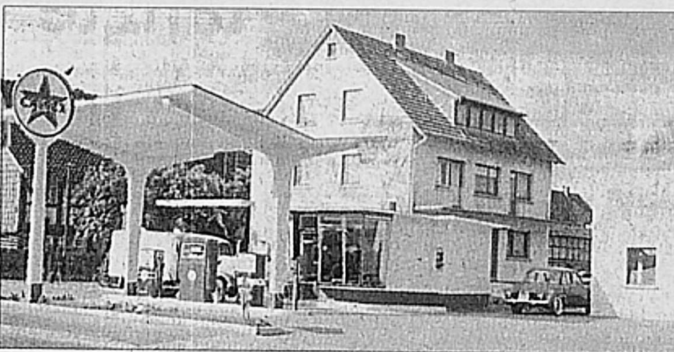
So sah die Tankstelle an der Harzburger Straße in Halchter früher aus.